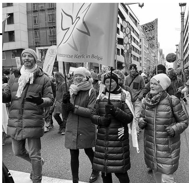
De klimaatmars op 3 december 2023 Daaraan voorafgaand: een gebedsmoment in de ‘Botanique-kerk’ (zie foto pag. 13)

Al in 2004 kwam de Wereldbond van Protestantse Kerken (WARC) in Accra (Ghana) samen. Nu 20 jaar geleden.