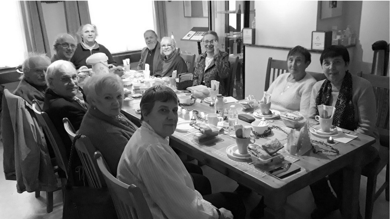
Advents- en Kerstontbijt in de kring van de Bethlehemkerk, bijeen in de Pastorij te Itterbeek

2024 zou een jubileumjaar worden met de woorden: "135 jaar Bethlehemkerk". Inderdaad, op 4 februari 1889 werd ze opgericht. In plaats van een jubileumjaar voor te bereiden viel in 2023 het besluit dat de Bethlehemkerk zou opgeheven worden.