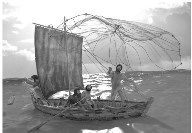
Vissersboot in de tijd van Jezus

“Snap jij dat?” zegt Petrus tegen Johannes. “Zelfs de wind en het water doen wat Hij zegt. Wat is Jezus toch voor iemand?”