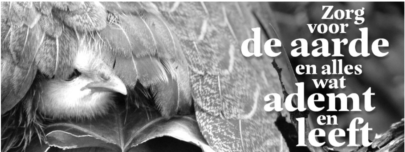
Zondag 1 september Scheppingszondag